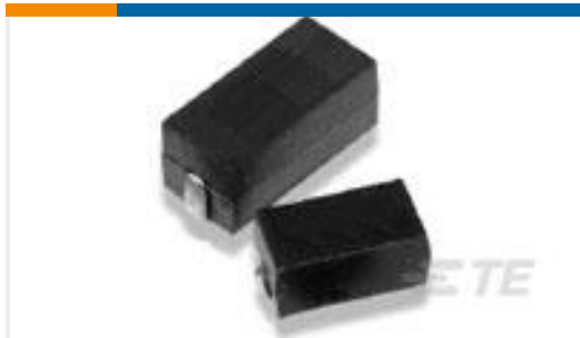
TE 产品编号4-1879021-7 SMW3 8R2 5%