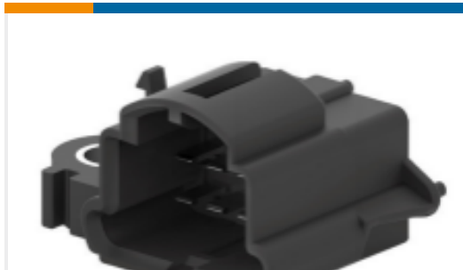
TE 产品编号1-174955-1 Low & Medium Power Header