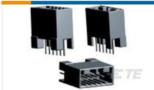
TE 产品编号1-174954-1 070 MLC CAP ASSY V 6P