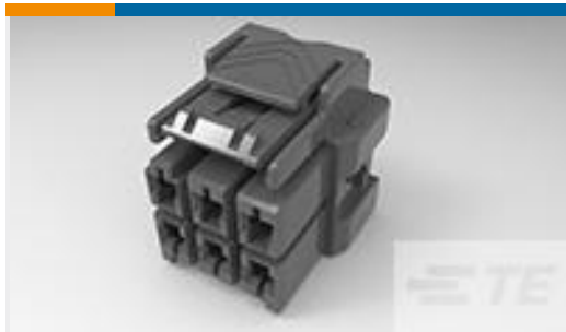
TE 产品编号5-2232266-3 PTL 2X3 PLUG HSG GLW WIRE KEY A DGR