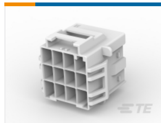
TE 产品编号 1-1971875-4 PTL 3X4 CAP PANEL MT STD TEMP KEY A NAT