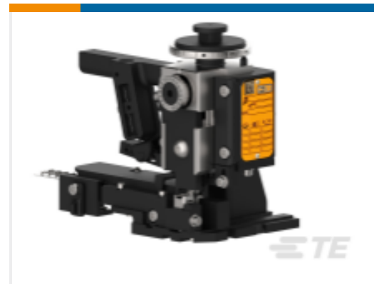
TE 产品编号 2151741-1 OCEAN_2.0 Applicator-S-120F190F