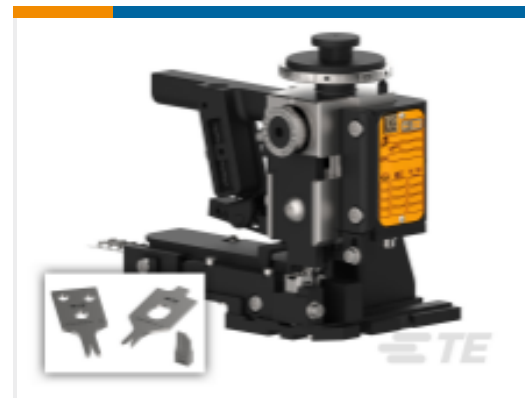
TE 产品编号 7-2151741-1 OCEAN_2.0 Applicator-S-120F190F