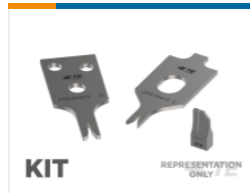
TE 产品编号 7-2151741-7 OCEAN_2.0_SPARE_PART_KIT-120F190F