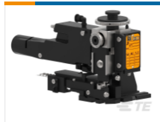
TE 产品编号 2151741-2 OCEAN_2.0 Applicator-S-120F190F