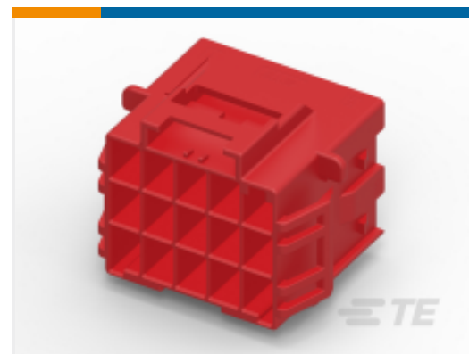
TE 产品编号 CAT-P87074-C1701A POWER TRIPLE LOCK High Temperature Caps