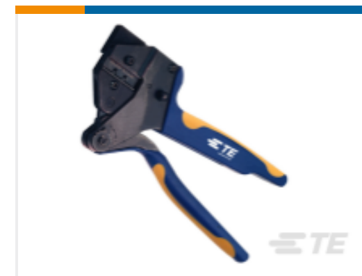
TE 产品编号 2217268-1 SDE HAND TOOL