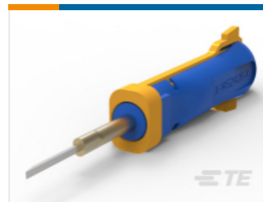
TE 产品编号 1452426-1 EXTRACTION TOOL