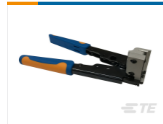
TE 产品编号 2305570-1 Strip Terminal Cutter-Side Feed-No Crimp