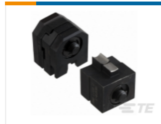
TE 产品编号 2217268-2 SDE DIE SEET