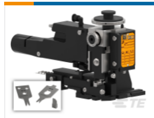
TE 产品编号 7-2151741-2 OCEAN_2.0 Applicator-S-120F190F