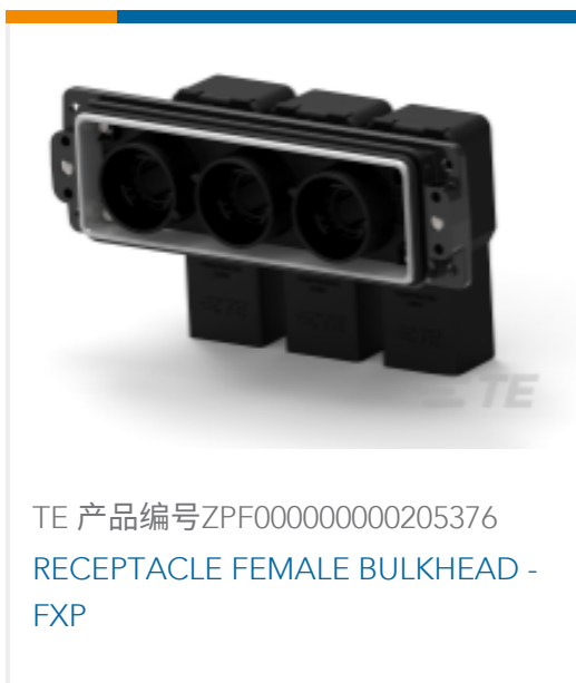
TE 产品编号ZPF000000000205376 RECEPTACLE FEMALE BULKHEAD - FXP