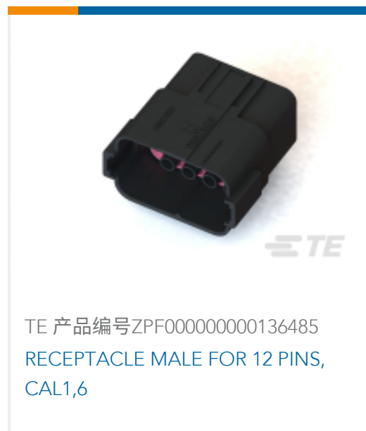
TE 产品编号ZPF000000000136485 RECEPTACLE MALE FOR 12 PINS, CAL1,6