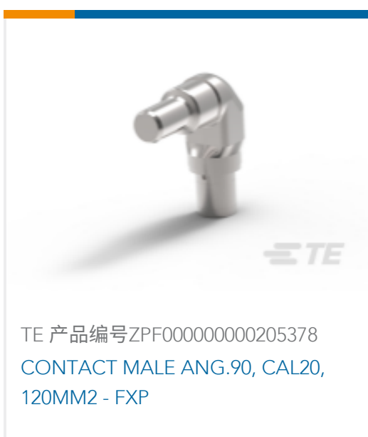
TE 产品编号ZPF000000000205378 CONTACT MALE ANG.90, CAL20, 120MM2 - FXP