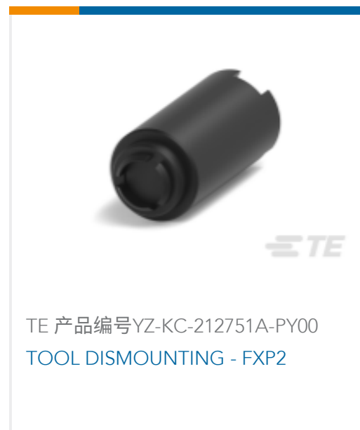
TE 产品编号YZ-KC-212751A-PY00 TOOL DISMOUNTING - FXP2