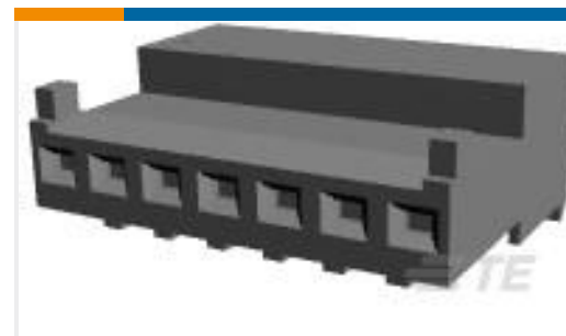
TE 产品编号3-643814-7 07P MTA100 CONN ASSY POL RIB