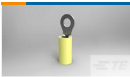
TE 产品编号2-36161-3 TERMINAL,PIDG R IR 12 10