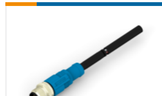
TE 产品编号T4161110005-005 RPC-M12-MS-5CON-PVC-5.0SH