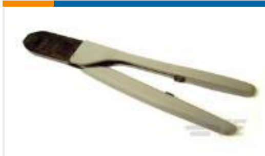
TE 产品编号91542-1 CCII TYPE III+ PIN SKT 24-22 ASSY