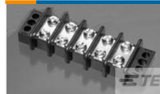
TE 产品编号1546310-8 8P .563" DR BARRIER STRIP