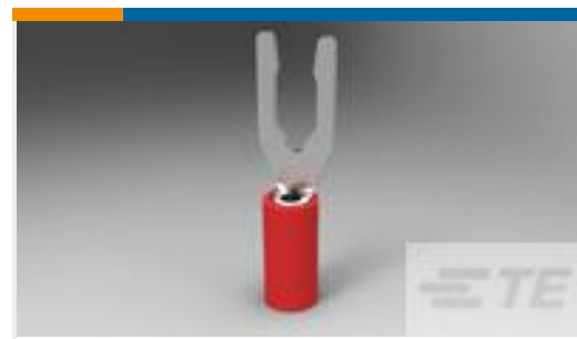
TE 产品编号52410 PIDG SP SPD 22-16COMM22-18MIL8