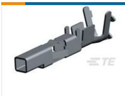
TE 产品编号2238021-1 VAL-U-LOK SKT BR SN 22-18 LP