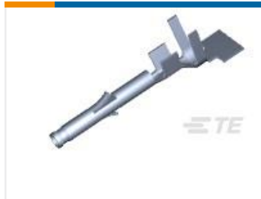
TE 产品编号171639-1 MINI U-M-N-L SOCKET L.P