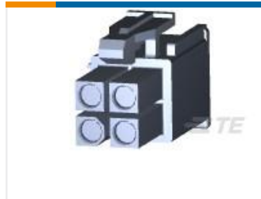
TE 产品编号172167-1 4 CIR UNIV M-N-L PLUG