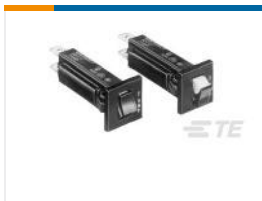
TE 产品编号6-1393250-0 W28-XTBB-15=W28