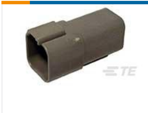
TE 产品编号DT04-6P REC, 6P, GRY, N