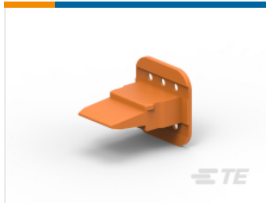
TE 产品编号W6S WEDGE LOCK, 6P, PLG, ORG, STD, DT