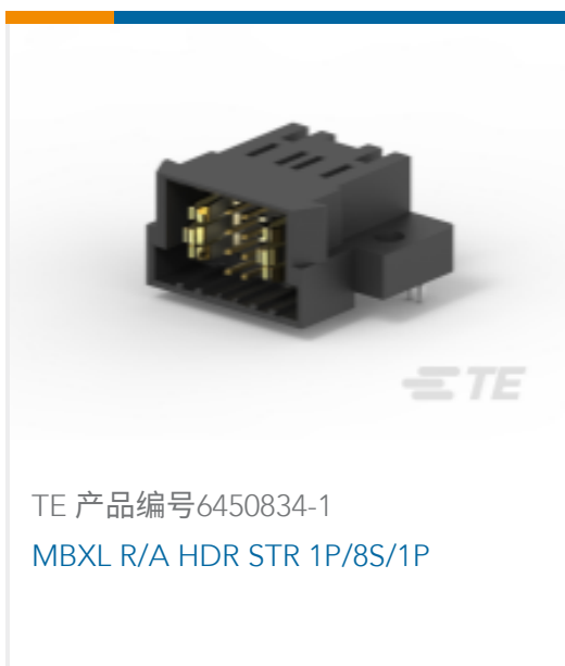
TE 产品编号6450834-1 MBXL R/A HDR STR 1P/8S/1P