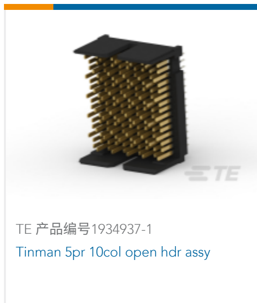
TE 产品编号1934937-1 Tinman 5pr 10col open hdr assy