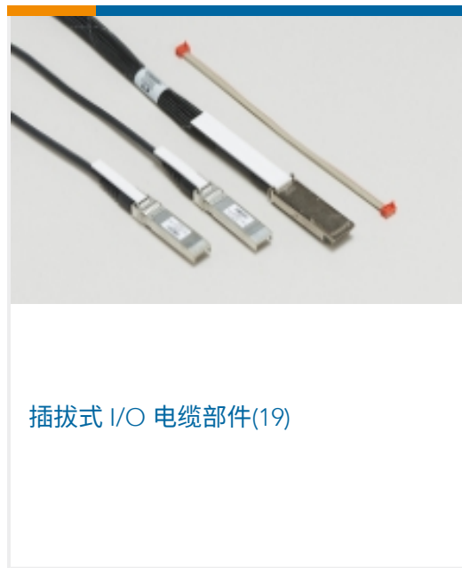
插拔式 I/O 电缆部件(19)