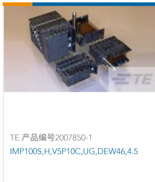
TE 产品编号2007850-1 IMP100S,H,V5P10C,UG,DEW46,4.5