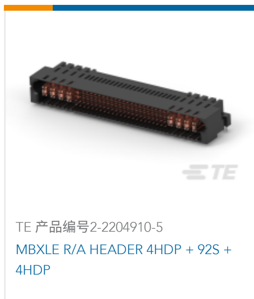
TE 产品编号2-2204910-5 MBXLE R/A HEADER 4HDP + 92S + 4HDP