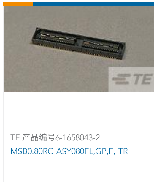
TE 产品编号6-1658043-2 MSB0.80RC-ASY080FL,GP,F,-TR