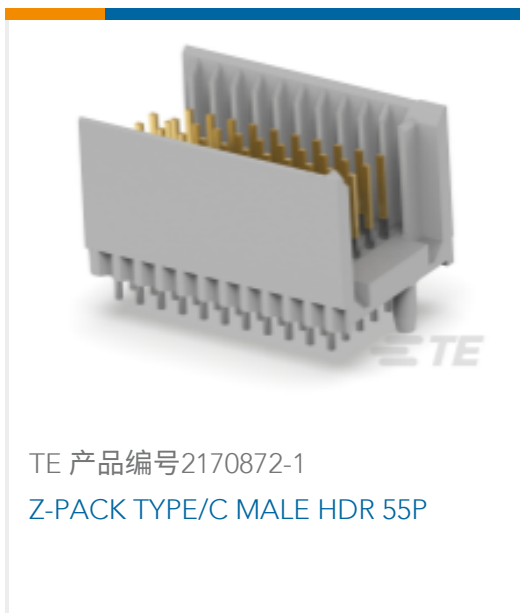
TE 产品编号2170872-1 Z-PACK TYPE/C MALE HDR 55P