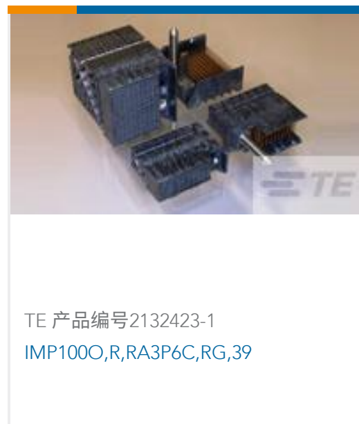
TE 产品编号2132423-1 IMP100O,R,RA3P6C,RG,39