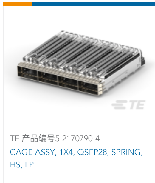
TE 产品编号5-2170790-4 CAGE ASSY, 1X4, QSFP28, SPRING, HS, LP