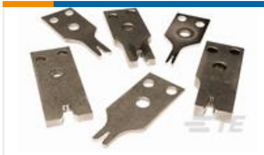
TE 产品编号1-453820-0 CRIMPER, WIRE-.070 WIDE F