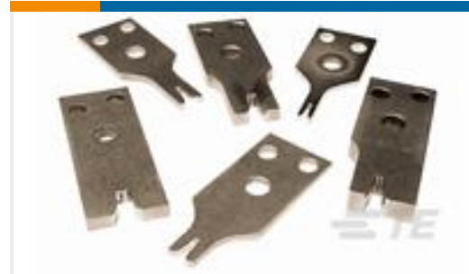
TE 产品编号9-1707070-3 WIRE CRIMPER