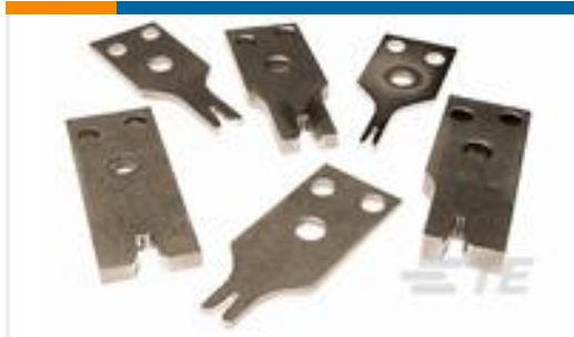
TE 产品编号7-571039-9 INSULATION CRIMPER