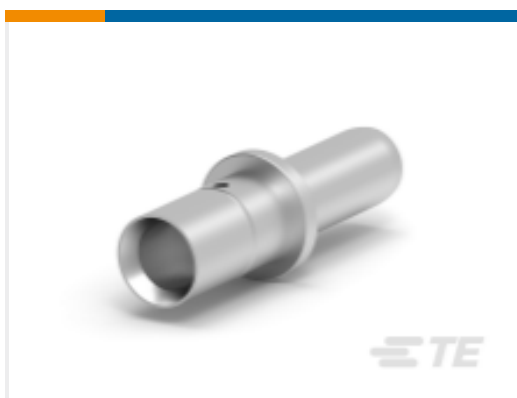
TE 产品编号SRK-PC-080-25-601 PIN, SOLID, SIZE M8, 25mm2, AG