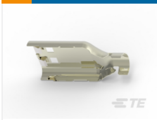
TE 产品编号1-2103157-2 SHIELD, PLUG, SIZE 2, Ag, HVA280