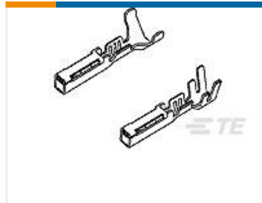
TE 产品编号173681-2 040 MULTILOCK REC CONT FORM