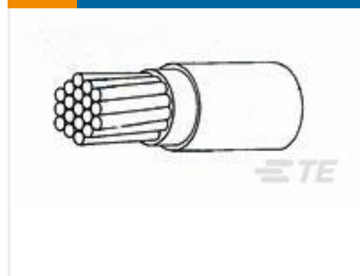
TE 产品编号4584443001 44A0111-14-9CK0001