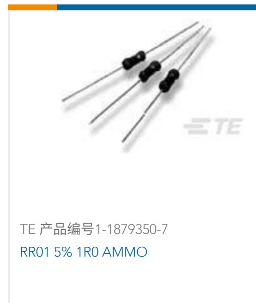
TE 产品编号1-1879350-7 RR01 5% 1R0 AMMO