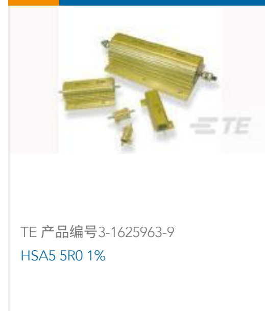
TE 产品编号3-1625963-9 HSA5 5R0 1%