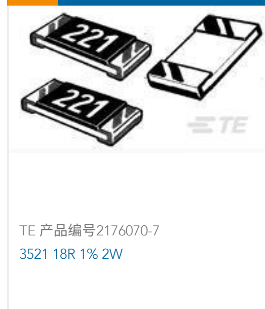
TE 产品编号2176070-7 3521 18R 1% 2W