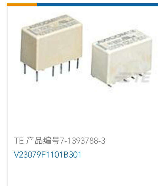
TE 产品编号7-1393788-3 V23079F1101B301