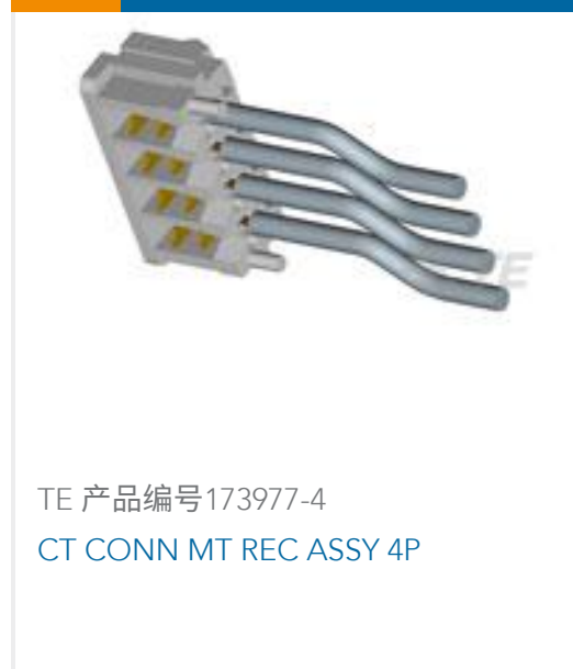
TE 产品编号173977-4 CT CONN MT REC ASSY 4P