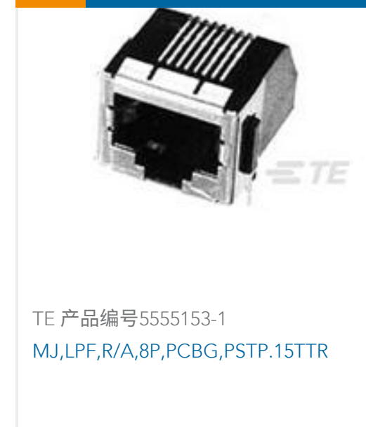
TE 产品编号5555153-1 MJ,LPF,R/A,8P,PCBG,PSTP.15TTR