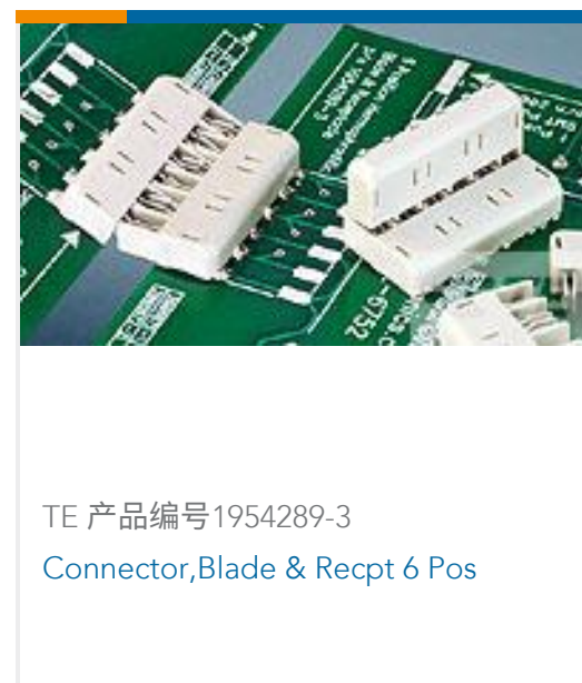
TE 产品编号1954289-3 Connector,Blade & Recpt 6 Pos