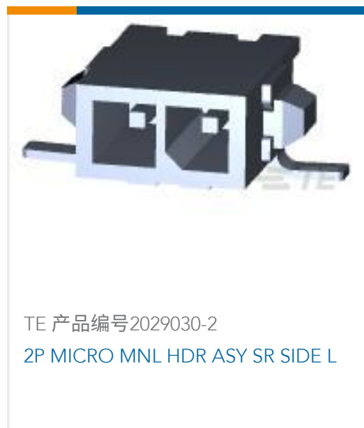
TE 产品编号2029030-2 2P MICRO MNL HDR ASY SR SIDE L