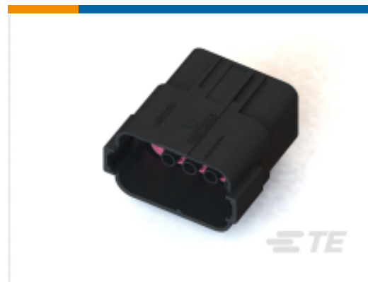
TE 产品编号ZPF000000000136485 RECEPTACLE MALE FOR 12 PINS, CAL1,6