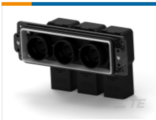
TE 产品编号ZPF000000000205376 RECEPTACLE FEMALE BULKHEAD - FXP