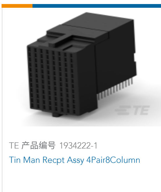
TE 产品编号 1934222-1 Tin Man Recpt Assy 4Pair8Column