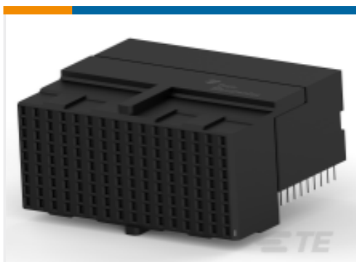
TE 产品编号 1934229-1 Tin Man Recept Assy 3 Pair16 Column