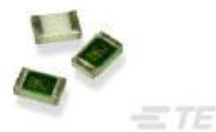
TE 产品编号1-1879417-9 CPF 0603 1M0 0.1% 25PPM 1K RL