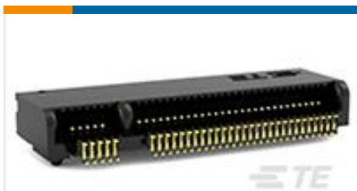
TE 产品编号2199119-3 M.2 0.5PITCH 3.2H KEY B 15U" AU