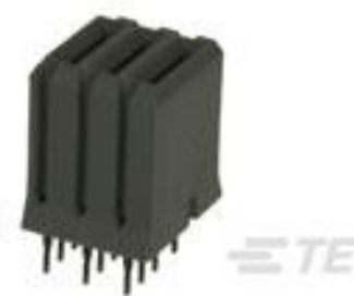
TE 产品编号5223955-2 TE UPM Ver Receptacle 3P STD Power