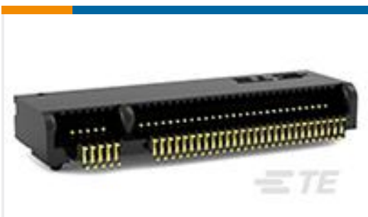
TE 产品编号2199119-5 M.2 0.5PITCH 3.2H KEY B 30U" AU