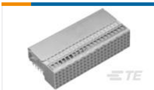
TE 产品编号5352152-1 Z-PACK/B22 RAF 110P