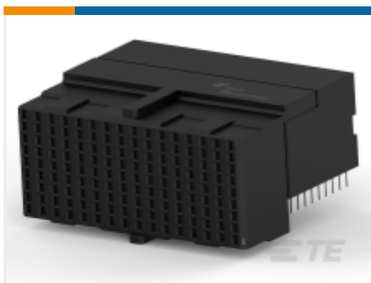
TE 产品编号 1934229-1 Tin Man Recept Assy 3 Pair16 Column