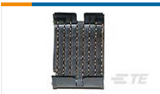
TE 产品编号1934331-1 Tin man Header Assy 5x16 Open