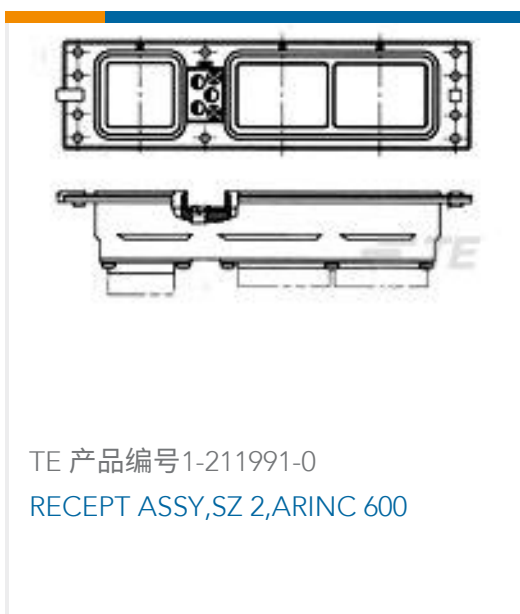
TE 产品编号1-211991-0 RECEPT ASSY,SZ 2,ARINC 600