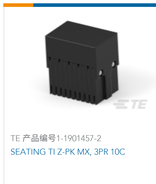
TE 产品编号1-1901457-2 SEATING TI Z-PK MX, 3PR 10C