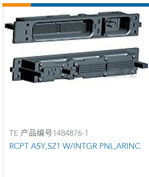
TE 产品编号1484876-1 RCPT ASY,SZ1 W/INTGR PNL,ARINC