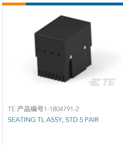
TE 产品编号1-1804791-2 SEATING TL ASSY, STD 5 PAIR