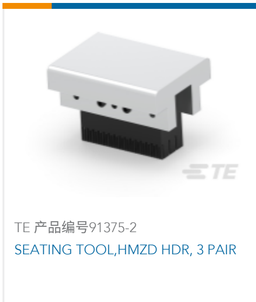
TE 产品编号91375-2 SEATING TOOL,HMZD HDR, 3 PAIR