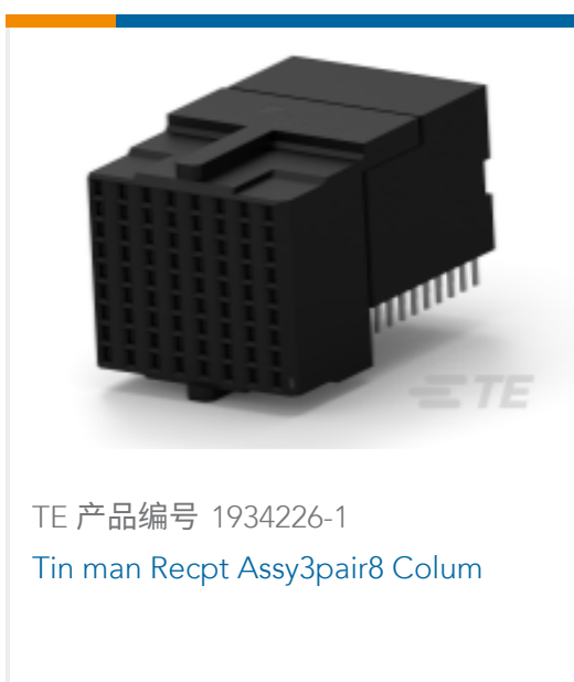
TE 产品编号 1934226-1 Tin man Recpt Assy3pair8 Colum