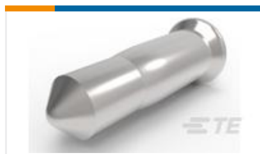
TE 产品编号1-5645501-2 SKT MS S4 BN SN-SN 10M W/SEAL