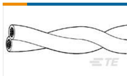
TE 产品编号462481-000 55PC0221-18-6/9