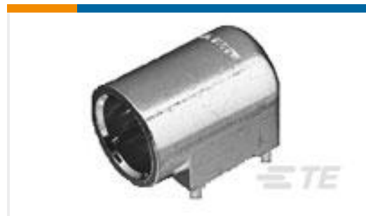
TE 产品编号5415406-2 TEST PLUG, RTANG, PCB, G