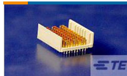
TE 产品编号6469083-2 HMZD 3PAIR, HDR ASSY, 25MM MOD