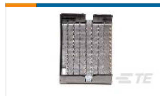
TE 产品编号1934272-1 Tin Man Header Assy 5x8 left