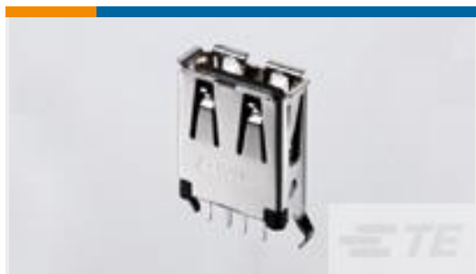
TE 产品编号1734366-3 Std USB Type A, VT, T/H, Blue