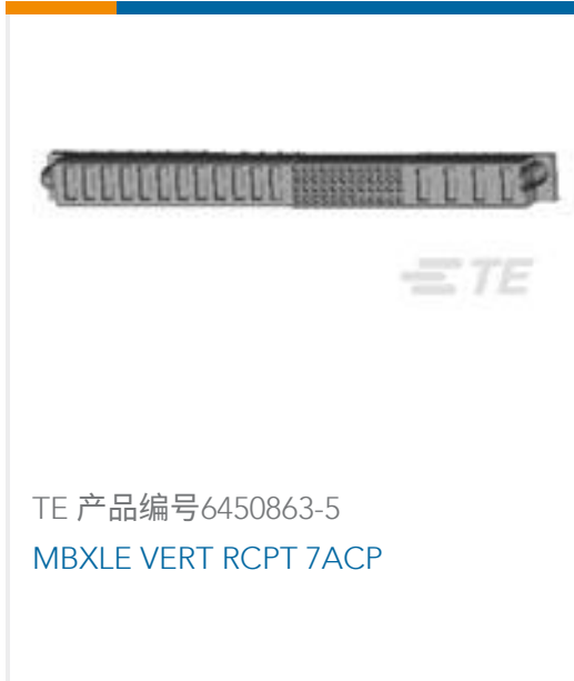
TE 产品编号6450863-5 MBXLE VERT RCPT 7ACP