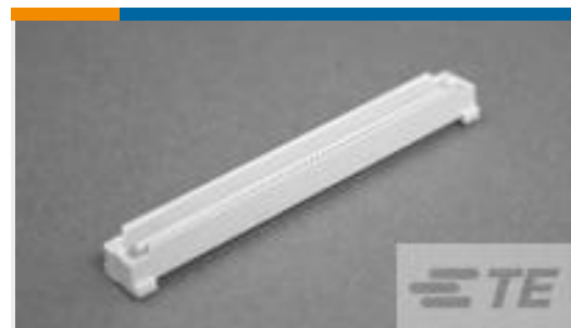
TE 产品编号5177984-6 0.8FH,P05H.5,140,08/Sn,TU