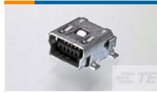
TE 产品编号1-1734035-2 MINI USB, TYPE B, R/A, SMT