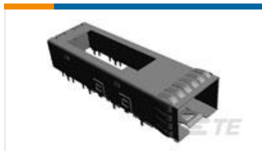
TE 产品编号2110304-1 SFP+ 1x1 Cage Assembly, Solder Tail