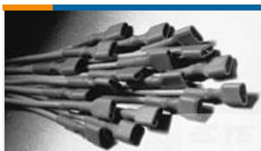
TE 产品编号4557596004 LSTT-19-2-30MM