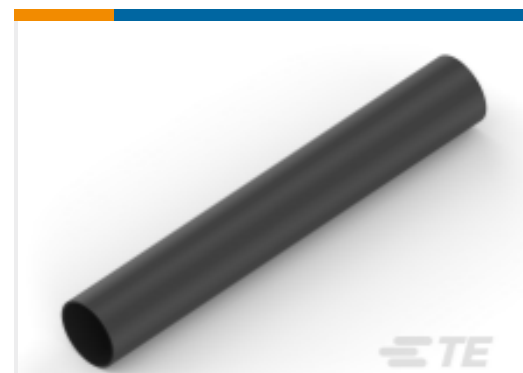
TE 产品编号0619356005 LSTT1 热缩管