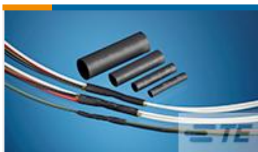
TE 产品编号2525596002 RBK-ILS-125-NR1-0-50MM