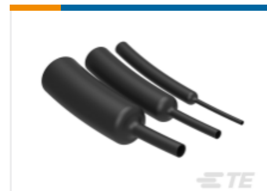
TE 产品编号1929496017 RNF-3000 Heat Shrink Tubing