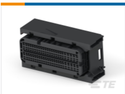
TE 产品编号8-1564284-5 96POS,MCON-1.2 CB,REC HSG,ASSY