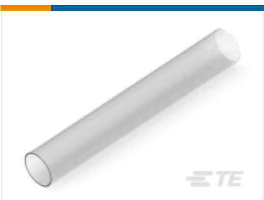
TE 产品编号3336796001 RBK-ESS-CROSS-10.0-X-8MM