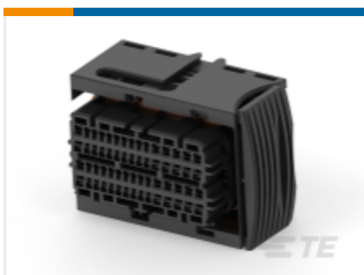
TE 产品编号2208277-3 60POS MQS REC SEALED