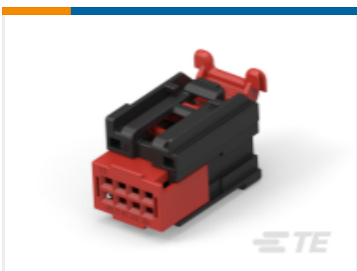
TE 产品编号1456987-1 2x4 Fem unsealed LP assy Key A