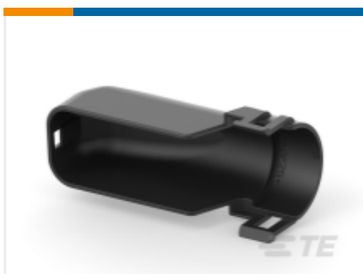
TE 产品编号2112046-2 COVER,90,FOR 26POS