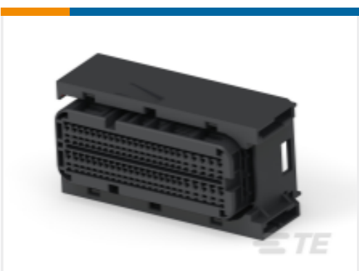
TE 产品编号8-1564284-6 96POS,MCON-1.2 CB,REC HSG,ASSY