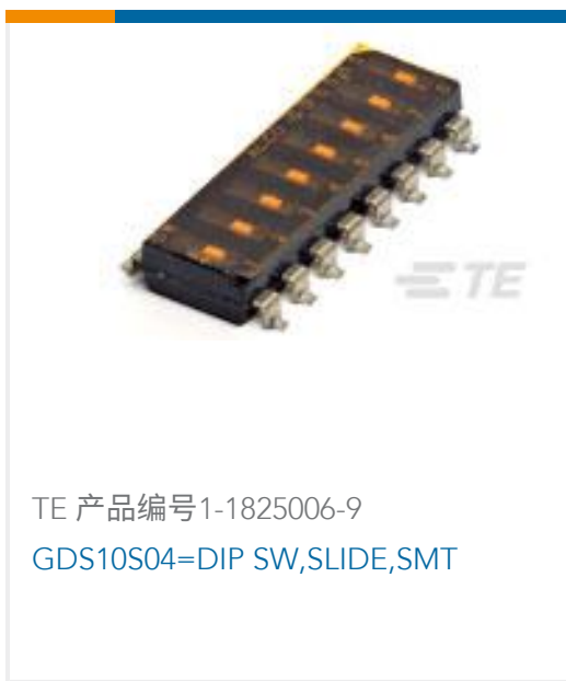
TE 产品编号1-1825006-9 GDS10S04=DIP SW,SLIDE,SMT