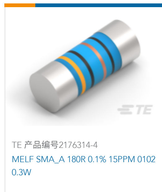
TE 产品编号2176314-4 MELF SMA_A 180R 0.1% 15PPM 0102 0.3W