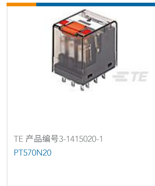
TE 产品编号3-1415020-1 PT570N20