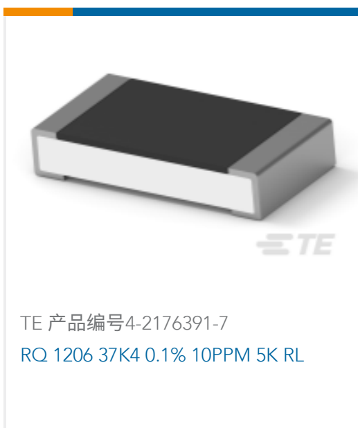
TE 产品编号4-2176391-7 RQ 1206 37K4 0.1% 10PPM 5K RL