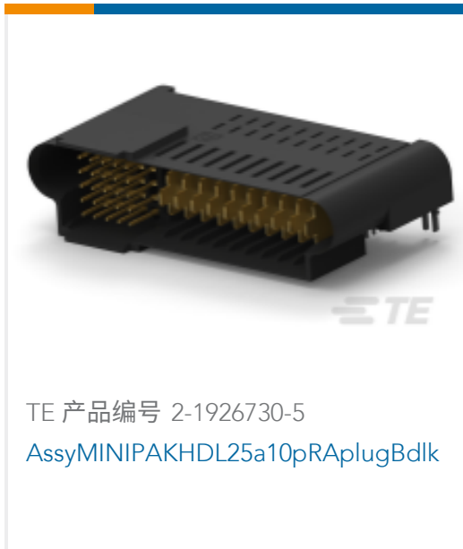
TE 产品编号 2-1926730-5 AssyMINIPAKHDL25a10pRAplugBdlk