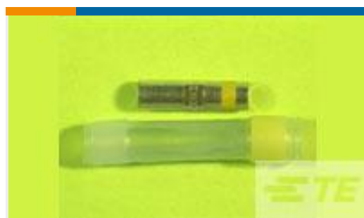
TE 产品编号650130-000 D-436-86