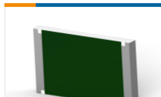
TE 产品编号2-2176406-5 3560 10R 1%