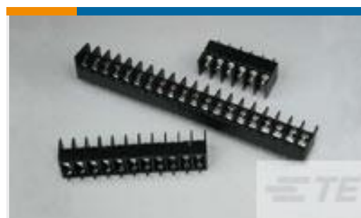
TE 产品编号1546657-2 2P PCV DUAL BARRIER,0.250