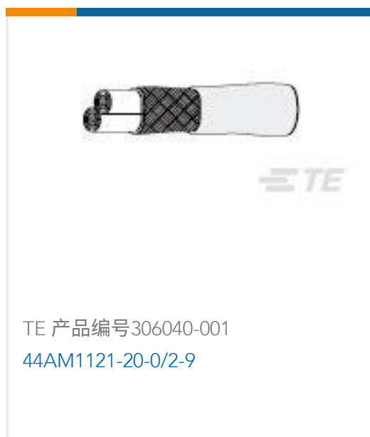
TE 产品编号306040-001 44AM1121-20-0/2-9