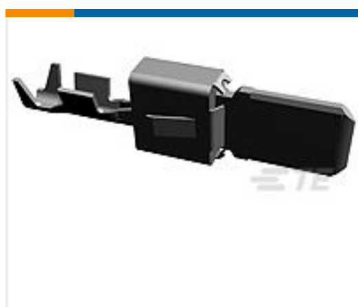
TE 产品编号1-963734-2 TAB 5.8x0.8 CONTACT CS SRC Ag