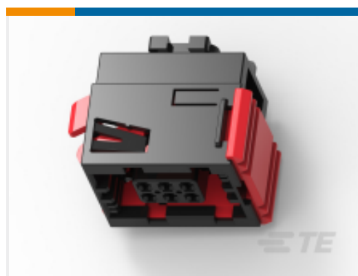
TE 产品编号6-1355683-3 MT3BU-GEH ASSY6P,SW