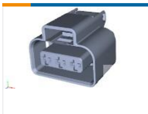
TE 产品编号1326460-1 ASSY, PLUG, 3P SEALED, 2.8MCP