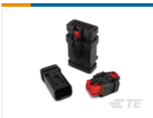
TE 产品编号776536-1 AMPSEAL 16 Housings