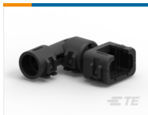
TE 产品编号2302491-2 SOC CONN CVRASSY,2POS, AMPSEAL16,90DEG,MC