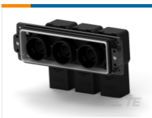
TE 产品编号ZPF000000000205376 RECEPTACLE FEMALE BULKHEAD - FXP