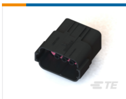
TE 产品编号ZPF000000000136485 RECEPTACLE MALE FOR 12 PINS, CAL1,6