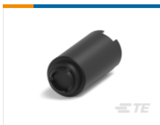
TE 产品编号YZ-KC-212751A-PY00 TOOL DISMOUNTING - FXP2