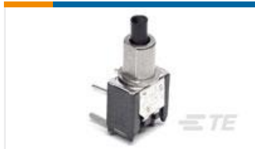
TE 产品编号1825096-5 TPA11CGRA204