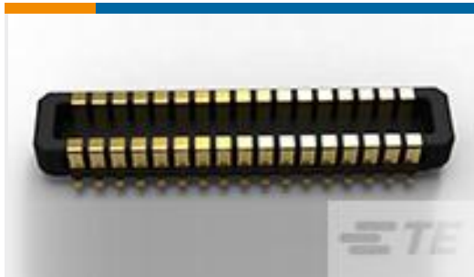
TE 产品编号1-2201196-0 0.4 STACKING CONN H0.98 PLUG ASSEMBLY