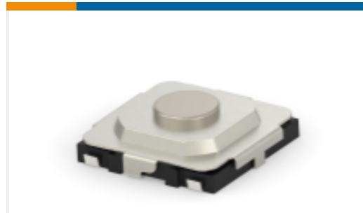
TE 产品编号2337243-3 TACT MINI JB 5.2X5.2X1.5 160GF