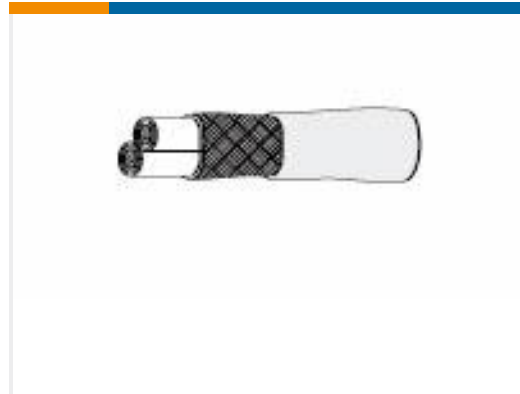
TE 产品编号272103-000 55A1123-20-9/96-9CS2275