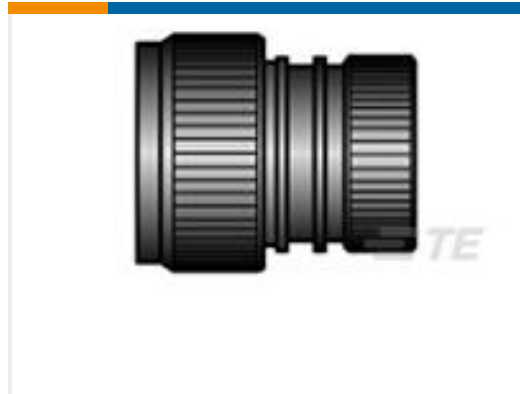
TE 产品编号527781-000 HEX40-AC-00-15-A5-1