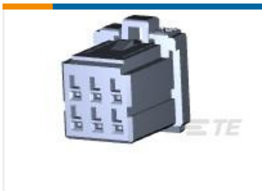
TE 产品编号1-1827864-3 DYNAMIC 1200D REC HSG 6P X BLACK