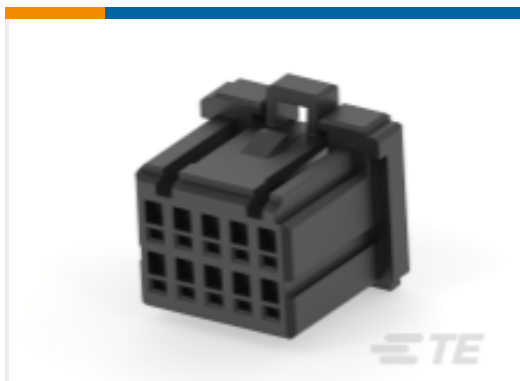
TE 产品编号1-1903128-0 Dynamic 1100 母端和公端壳体