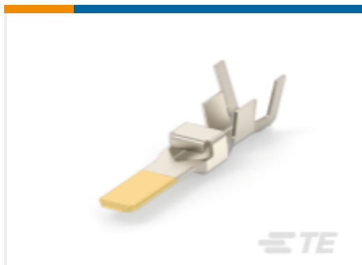
TE 产品编号316041-3 Contact: Component To Wire ; 20-45A , 20-8 wire size