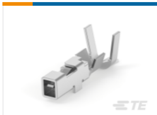
TE 产品编号1871745-1 Contact: Component To Wire ; 3-5A, 30-18 Wire Size