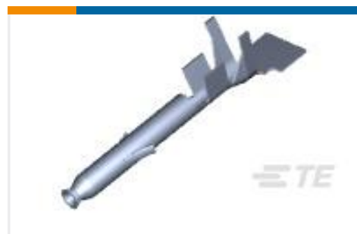
TE 产品编号1-770904-0 MINI UMNL SOK 22-18 AWG AU