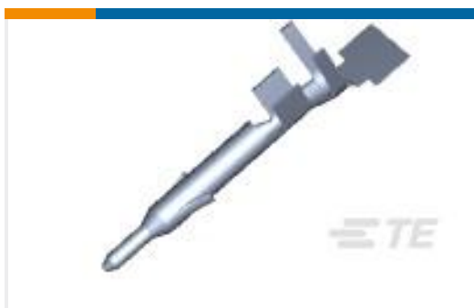
TE 产品编号770903-1 MINI UMNL PIN 22-18 AWG SN