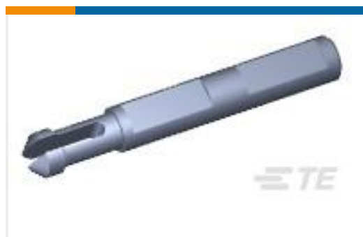
TE 产品编号770377-1 UMNL II KEYING PLUG