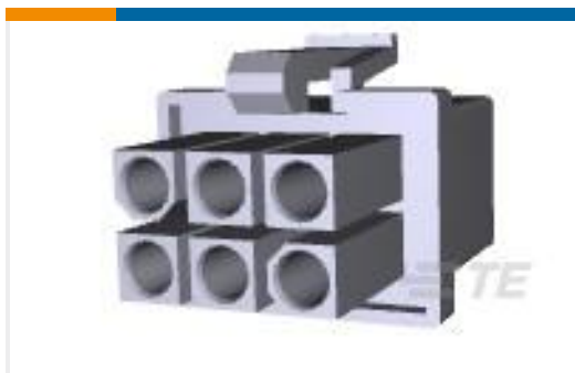
TE 产品编号794895-1 6 CIR MINI UMNL RND WIRE HOLES