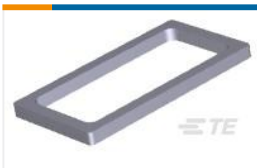
TE 产品编号794772-4 04P MINI UMNL SEAL,DIE CUT