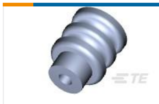
TE 产品编号794758-1 MINI UMNL WIRE SEAL,18-26AWG