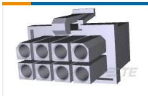
TE 产品编号794821-1 08P MINI UMNL PLUG HSG