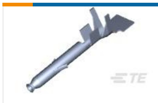
TE 产品编号770904-1 MINI UMNL SOK 22-18 AWG SN