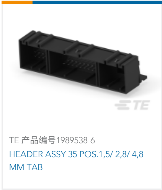
TE 产品编号1989538-6 HEADER ASSY 35 POS.1,5/ 2,8/ 4,8 MM TAB