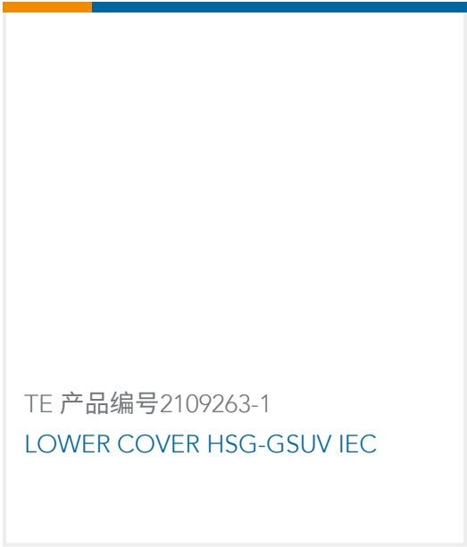
TE 产品编号2109263-1 LOWER COVER HSG-GSUV IEC