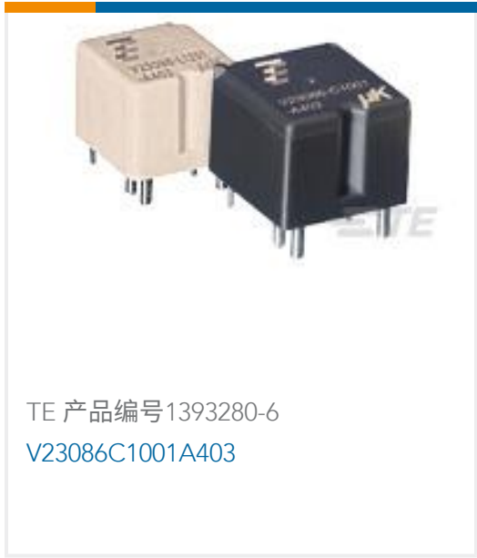
TE 产品编号1393280-6 V23086C1001A403