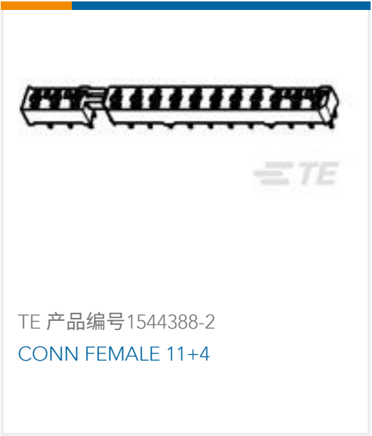
TE 产品编号1544388-2 CONN FEMALE 11+4