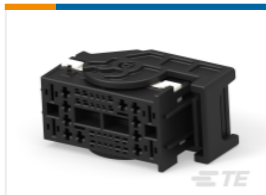
TE 产品编号2-2188532-2 HYB LIF 38P PLUG ASSY FOR AD