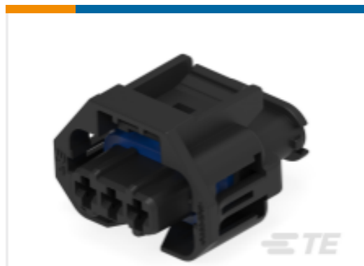
TE 产品编号1-2005390-6 JPT SLD 3P PLUG ASSY-2S BLK TYPE2