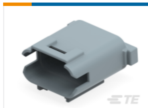
TE 产品编号2373974-3 025 14P JOINT CAP ASSY TYPE C