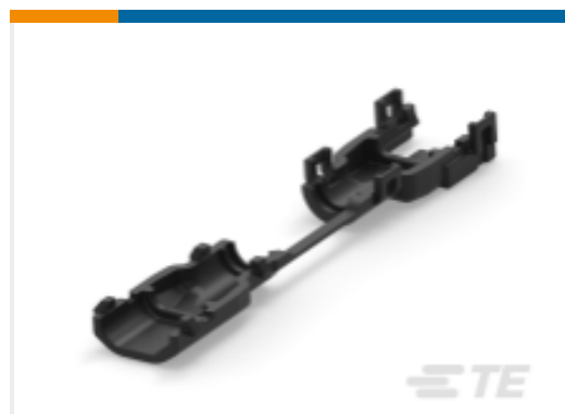
TE 产品编号2356989-2 WIRE COVER FOR MCP1.5 2P PLUG