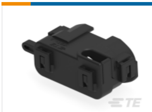
TE 产品编号1-1743645-2 COVER HSG FOR JPT 2P ASSY BLK TYPE2