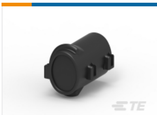
TE 产品编号2219369-2 COVER BLK FOR MT-II 6P PLUG