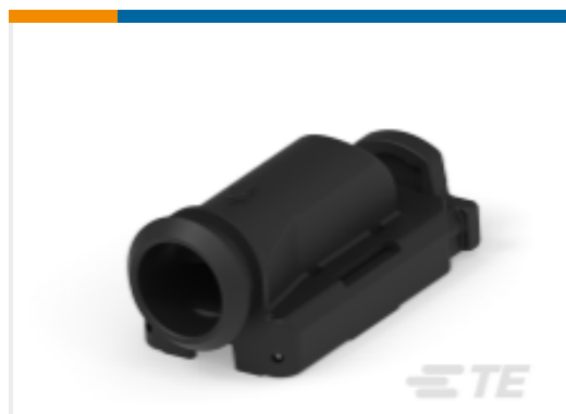
TE 产品编号2309585-2 025/060/110 HYB26P SLIDER COVER ASSY