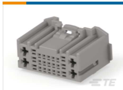
TE 产品编号2109520-3 025/060/110 HYB 25P PLUG ASSY GRY