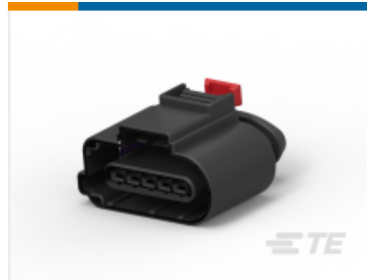
TE 产品编号1897207-2 AMP MCP, 密封连接器壳体