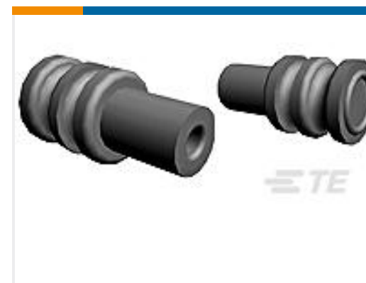
TE 产品编号963530-1 EINZELLEITERDICHTNG