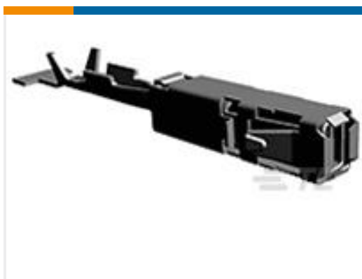
TE 产品编号1241380-2 AMP MCP 1.5K, CONTACT, SWS