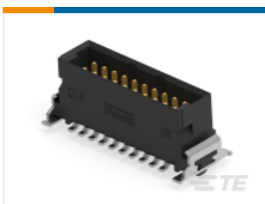
TE 产品编号254588-E SMCQ 20 M AB VV 8-13 CL * H007 137 E005