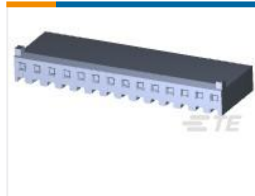
TE 产品编号1-770849-4 14P SL156 HSG W/LOC RAMP W/TBS