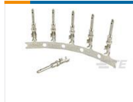
TE 产品编号1060-16-0622 PIN, SF, SIZE 16, 16-20, NI/SN