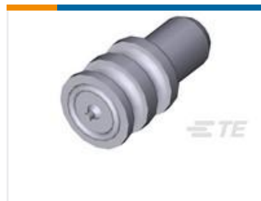
TE 产品编号963531-1 BLINDSTOPFEN