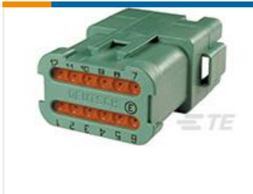
TE 产品编号DT04-12PC-CE07 REC, 12P, GRN, E, ENH KEY, CAP, C