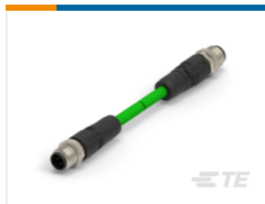
TE 产品编号TAD14745101-007 M12D4-MS-MS-PUR TYPE C GREEN-10.0M