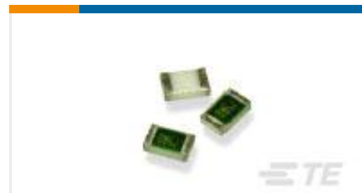
TE 产品编号4-1614881-8 CPF 0603 33R 0.1% 25PPM 5K RL