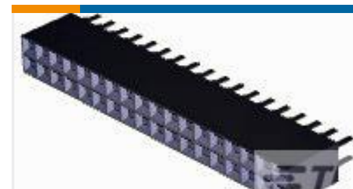
TE 产品编号1-534998-8 36 MODIV VRT DR CE 100/125