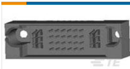
TE 产品编号6600330-4 MBXL VERT HDR 1P+24S+1P