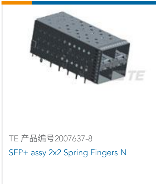
TE 产品编号2007637-8 SFP+ assy 2x2 Spring Fingers N