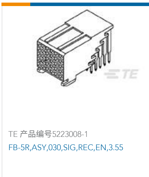
TE 产品编号5223008-1 FB-5R,ASY,030,SIG,REC,EN,3.55