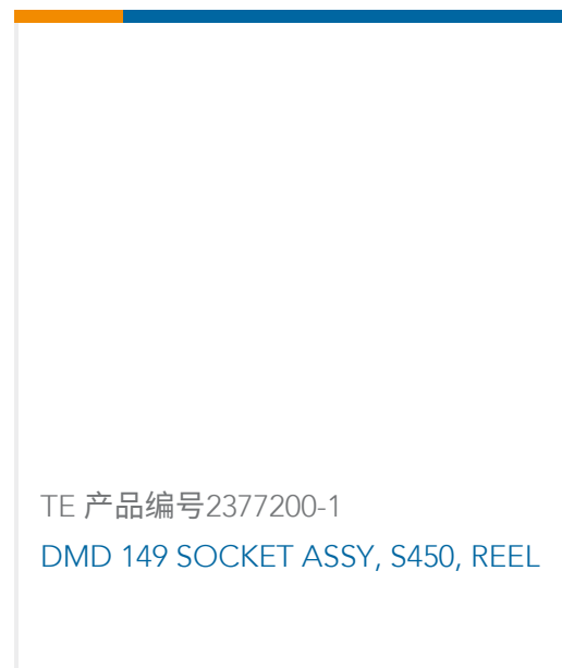
TE 产品编号2377200-1 DMD 149 SOCKET ASSY, S450, REEL