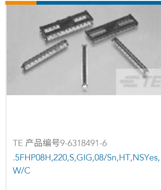
TE 产品编号9-6318491-6 .5FHP08H,220,S,GIG,08/Sn,HT,NSYes, W/C