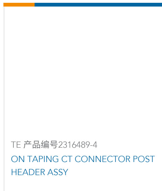
TE 产品编号2316489-4 ON TAPING CT CONNECTOR POST HEADER ASSY