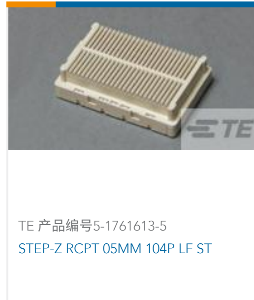
TE 产品编号5-1761613-5 STEP-Z RCPT 05MM 104P LF ST