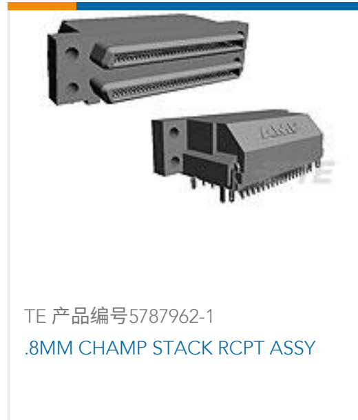
TE 产品编号5787962-1 .8MM CHAMP STACK RCPT ASSY