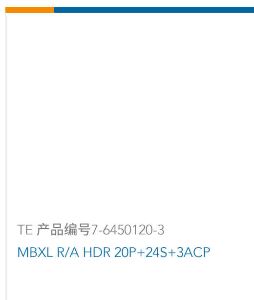
TE 产品编号7-6450120-3 MBXL R/A HDR 20P+24S+3ACP