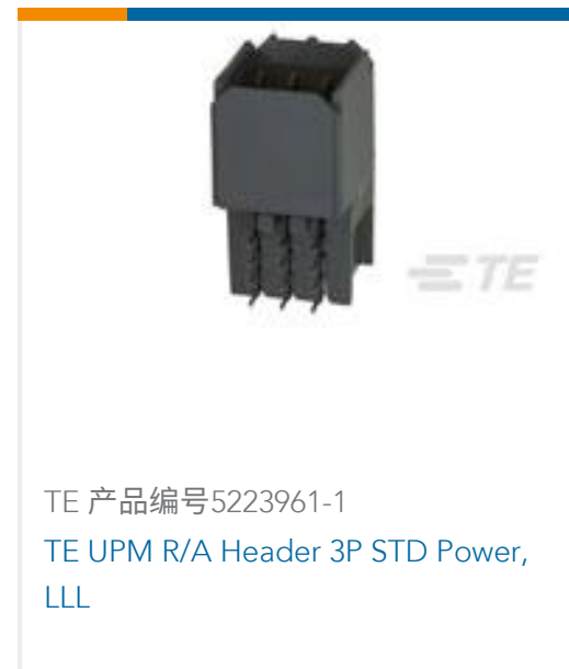
TE 产品编号5223961-1 TE UPM R/A Header 3P STD Power, LLL