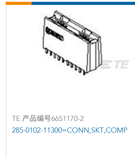
TE 产品编号6651170-2 285-0102-11300=CONN,SKT,COMP LLL