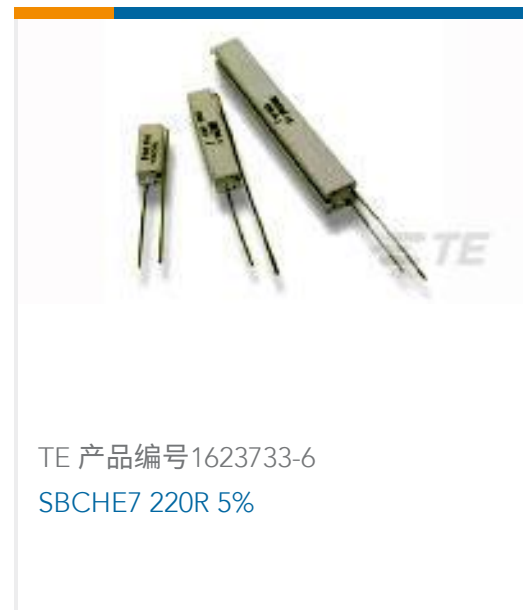
TE 产品编号1623733-6 SBCHE7 220R 5%