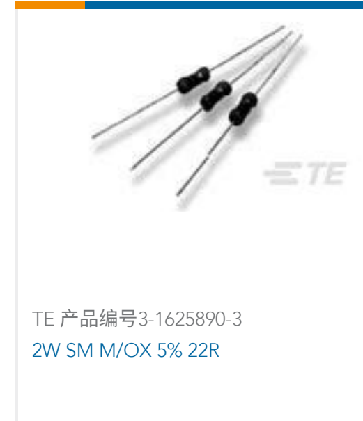
TE 产品编号3-1625890-3 2W SM M/OX 5% 22R