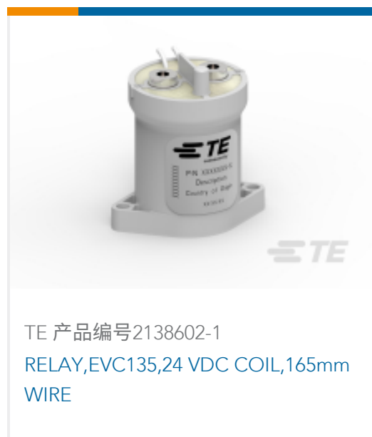
TE 产品编号2138602-1 RELAY,EVC135,24 VDC COIL,165mm WIRE