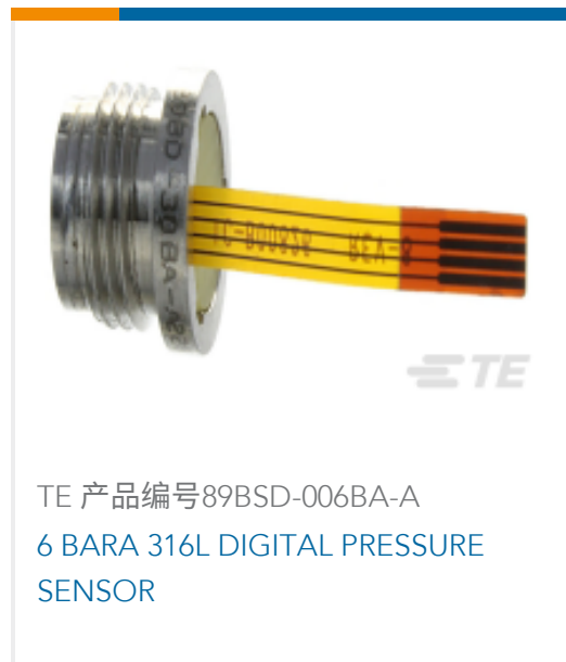
TE 产品编号89BSD-006BA-A 6 BARA 316L DIGITAL PRESSURE SENSOR