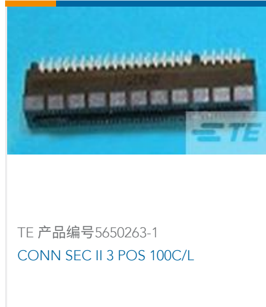
TE 产品编号5650263-1 CONN SEC II 3 POS 100C/L