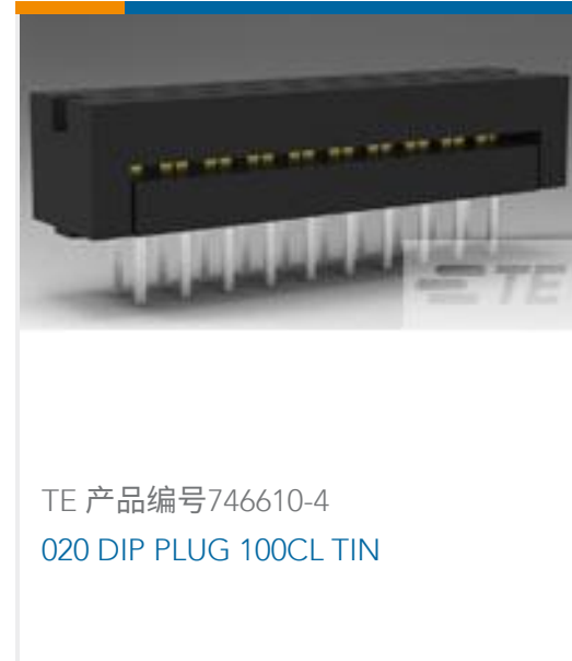
TE 产品编号746610-4 020 DIP PLUG 100CL TIN