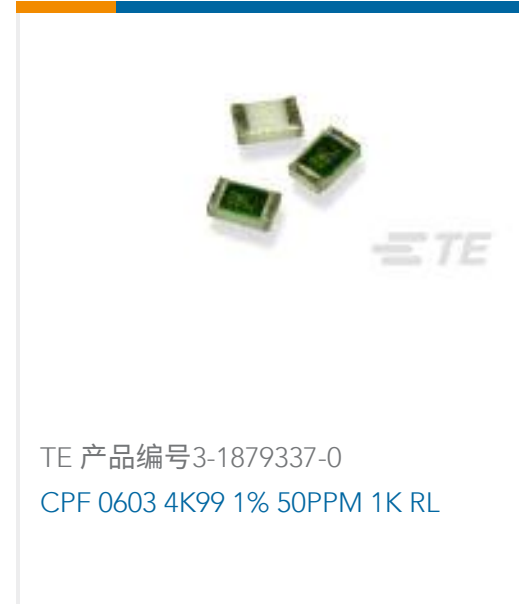
TE 产品编号3-1879337-0 CPF 0603 4K99 1% 50PPM 1K RL