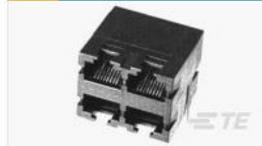
TE 产品编号2041376-2 RJ45 W LED 2X2,30u",DIP,H=25.4mm