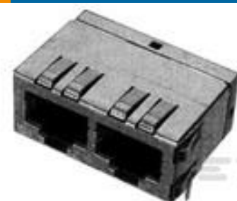
TE 产品编号5406566-2 MJ,2PORT,8P,SHLD,PNL GRDS,CAT5