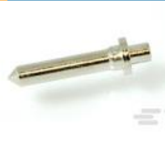
TE 产品编号1410548-4 MULTIGIG GD PIN KEY/ESD NI PLT, 2.60