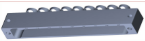
TE 产品编号2-1589072-4 CX090L2AQ = Coax