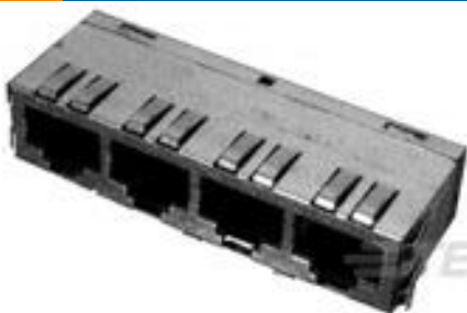
TE 产品编号5406275-3 MJ ASSY,4P,8POS,SH,RVPGT,CAT5