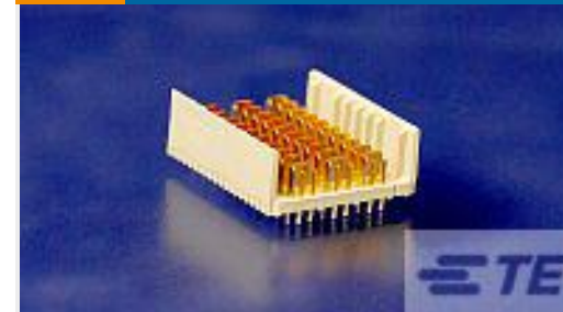
TE 产品编号6469083-1 HMZD 3PAIR, HDR ASSY, 25MM MOD