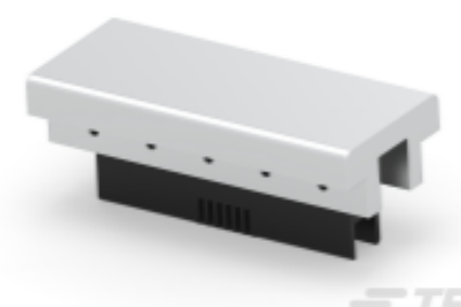
TE 产品编号1-1804872-0 SEATING TL, ASSY