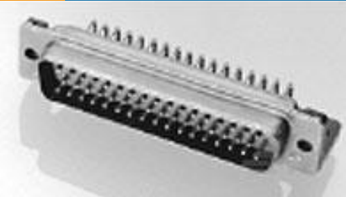
TE 产品编号1218440-1 AMPLIMITE,ASY,PLUG,RT ANG,109,1