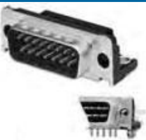
TE 产品编号5747250-4 09 MSFL PLUG RA 318 (IN,FM)