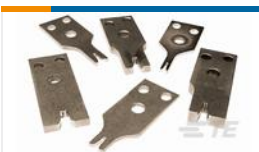
TE 产品编号5-1490019-5 CRIMPER, WIRE (.073" 'F')