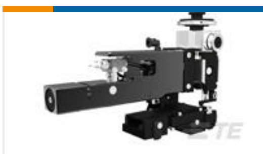
TE 产品编号2151279-2 OCEAN_2.0_APPLICATOR-S-080F1000