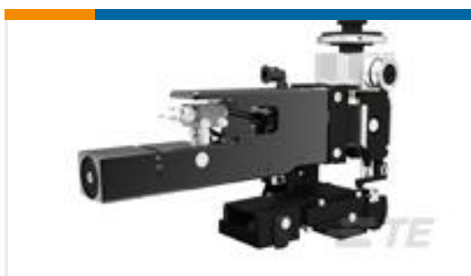
TE 产品编号2151218-2 OCEAN_2.0_Applicator-S-080F1000