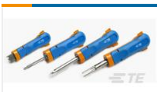
TE 产品编号7-1579008-3 UNLOCKING TOOL