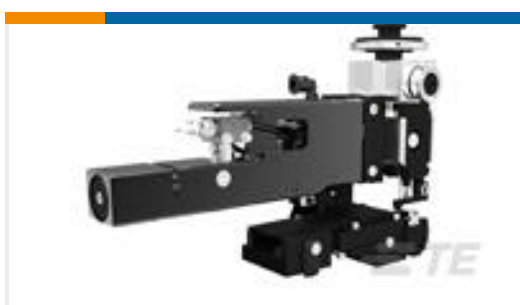
TE 产品编号2151218-2 OCEAN_2.0_Applicator-S-080F1000