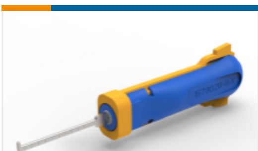
TE 产品编号1579028-8 EXTRACTION TOOL