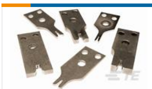
TE 产品编号5-1490019-5 CRIMPER, WIRE (.073" 'F')