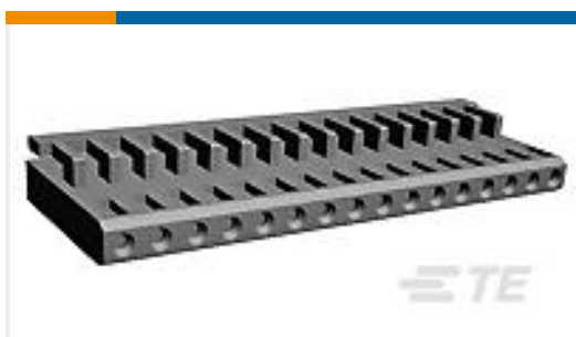
TE 产品编号1-926475-2 MOD 4 HSG