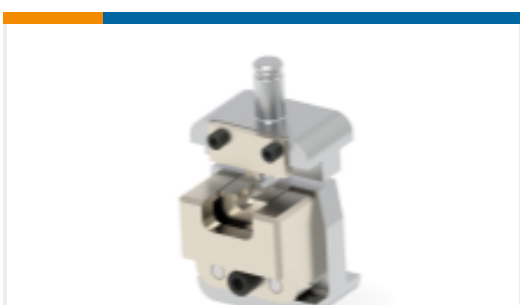
TE 产品编号2358638-1 DIE SET DIA 6MM T 6MM2