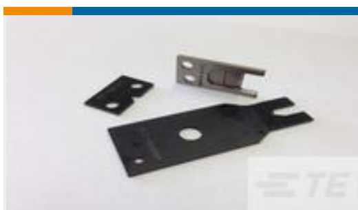
TE 产品编号1-2217206-5 Blade, Slug