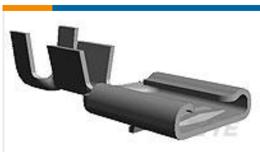
TE 产品编号160920-4 FF 312 REC 2.5-4MM2 TPPB