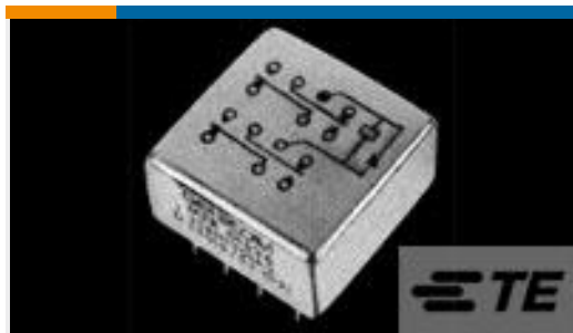
TE 产品编号1617348-1 3SBH5004K6=RELAY