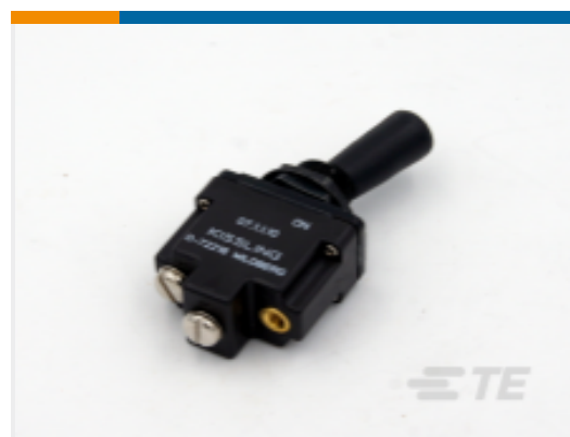
TE 产品编号K1007153 Toggle Switch 08-1-1-13