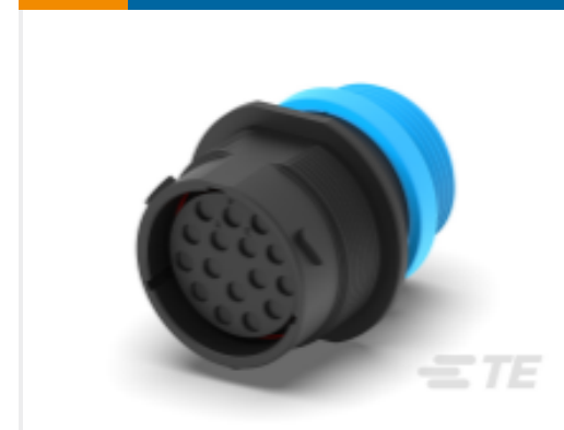
TE 产品编号HDP24-24-16SE-L015 REC, 16P, BLK, E, THD, 12, S