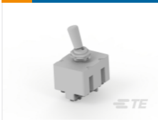
TE 产品编号K1002956 Toggle Switch 08-4-1-13