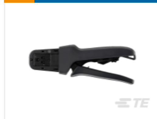
TE 产品编号DTT-20-03 CRIMP TOOL