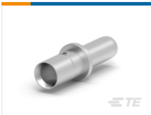
TE 产品编号SRK-PC-080-25-601 PIN, SOLID, SIZE M8, 25mm2, AG