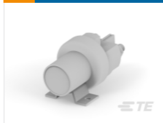
TE 产品编号K1008699 Relay 26-60-05