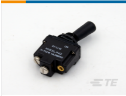
TE 产品编号K1007153 Toggle Switch 08-1-1-13