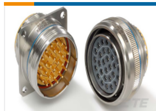
TE 产品编号ZPF000000000202269 983-6SE 12-21 SN