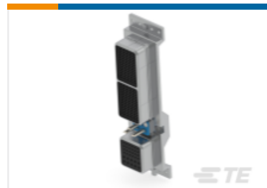
TE 产品编号2157236-1 ARINC PLUG,Sz2,150/150/34,CHRO