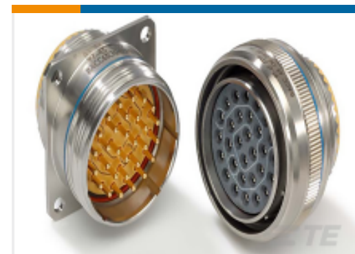
TE 产品编号ZPF000000000202715 983-7SE 12-21 PN