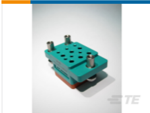
TE 产品编号1618398-5 5341=28VDC GFI SOCKET STANDARD