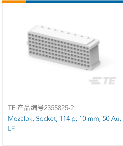
TE 产品编号2355825-2 Mezalok, Socket, 114 p, 10 mm, 50 Au, LF