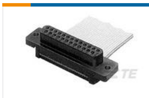
TE 产品编号1658609-3 15 POS HDF RCPT, AP, LEAD FREE