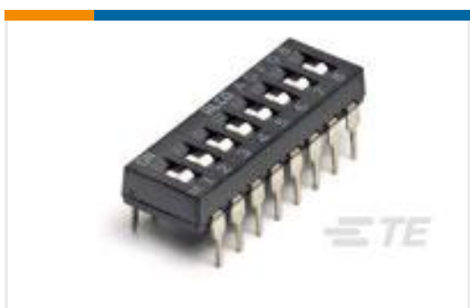
TE 产品编号2-1825059-3 ADF05ST04=DIP SWT,FLUSH,SMT-GW