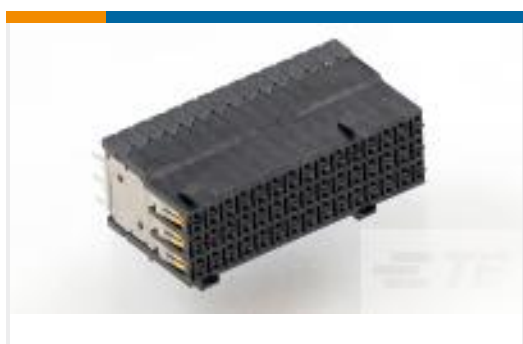
TE 产品编号5120786-1 ZP HS3 DB 06R REC 060P CT PD