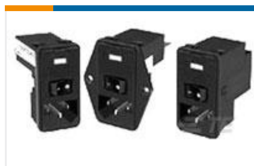
TE 产品编号1-6609107-7 PS0S0SS60=C1044