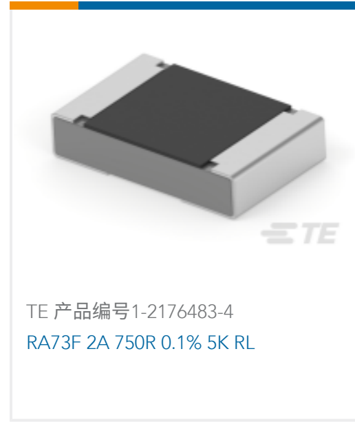
TE 产品编号1-2176483-4 RA73F 2A 750R 0.1% 5K RL