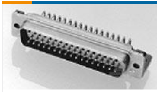
TE 产品编号1757836-2 AMPLIMITE,R/A RCPT ASY,109,ZN,2