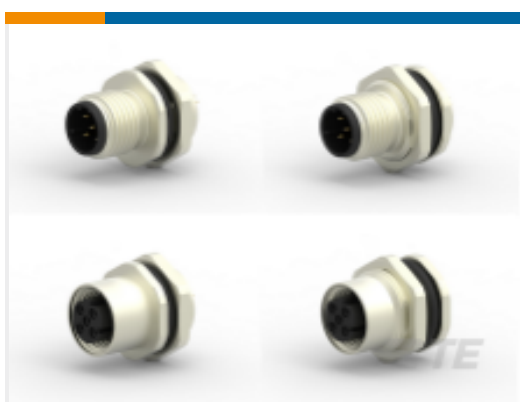
TE 产品编号T4133012051-000 M12 面板安装焊杯