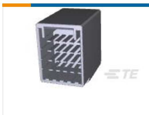
TE 产品编号917251-2 DYNAMIC D-3400F HDR ASSY 20P H