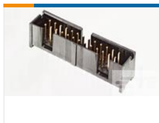
TE 产品编号2-1761603-9 IDC LOW PRO HDR 26P VERT BLUE