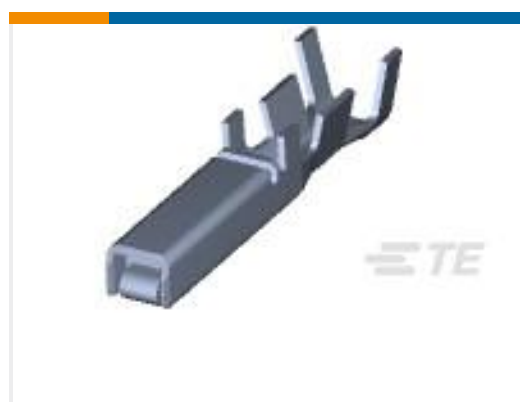
TE 产品编号175196-3 DYNAMIC D-3 REC CONT/L AU 0.76