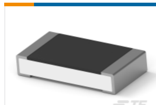
TE 产品编号1-2176391-0 RQ 1206 15K4 0.1% 10PPM 5K RL