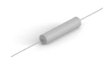
TE 产品编号9-2176415-1 8W STD M/OX 5% 160K