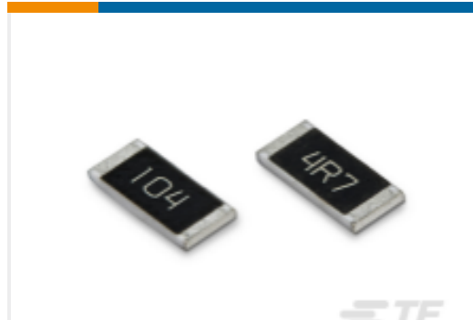
TE 产品编号2-2176455-5 CPF 0402 7R5 0.1% 25ppm 1K RL