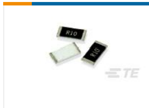
TE 产品编号 2-1879461-5 RL73H 2A R13 1% 1K RL