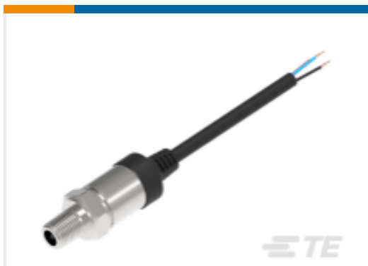
TE 产品编号 20014203-12 PRESS XDCR M325M-000005-250PG