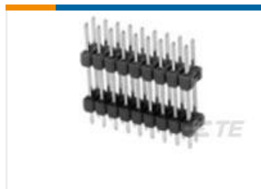
TE 产品编号 5-146496-2 04 MODII HDR DRST UNSHRD STKG