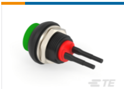
TE 产品编号 2329359-9 PB ON/OFF HC GRE M1 TERM IP68 500MM LHS