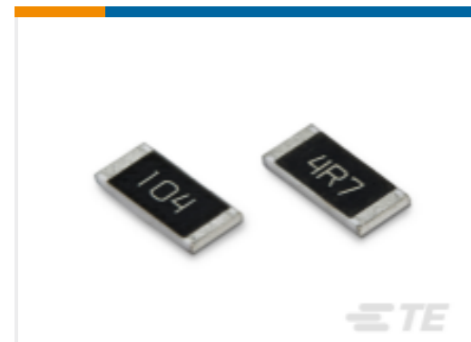
TE 产品编号 2-2176455-5 CPF 0402 7R5 0.1% 25ppm 1K RL