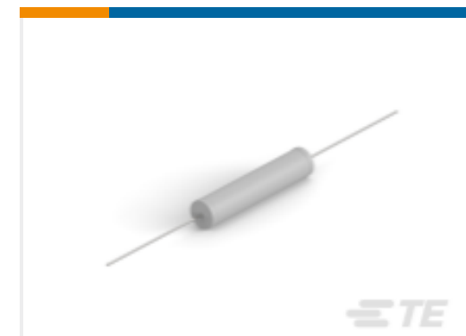
TE 产品编号 9-2176415-1 8W STD M/OX 5% 160K