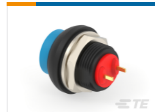
TE 产品编号 2-2329328-0 PB OFF/ON HC BLU M4 TERM. IP68