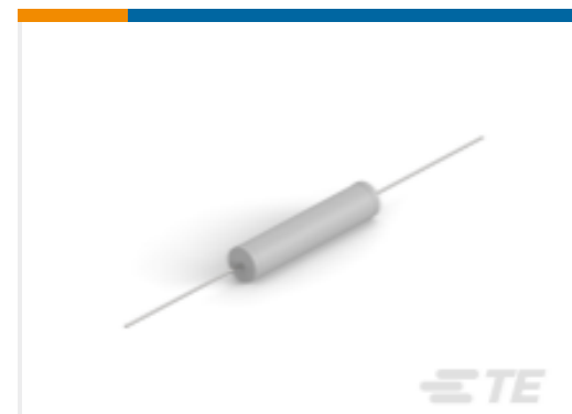
TE 产品编号 9-2176415-0 8W STD M/OX 5% 150K