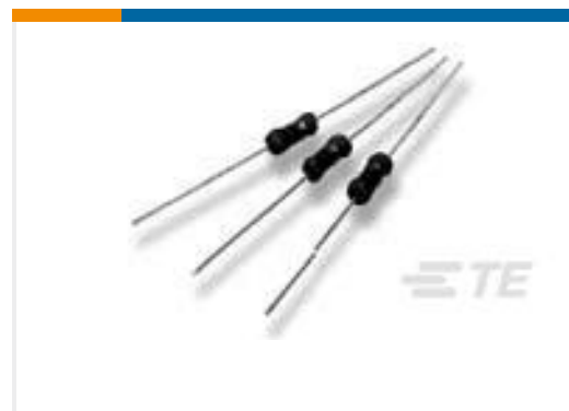
TE 产品编号 1-1625893-3 5W SM M/OX 2% 22R